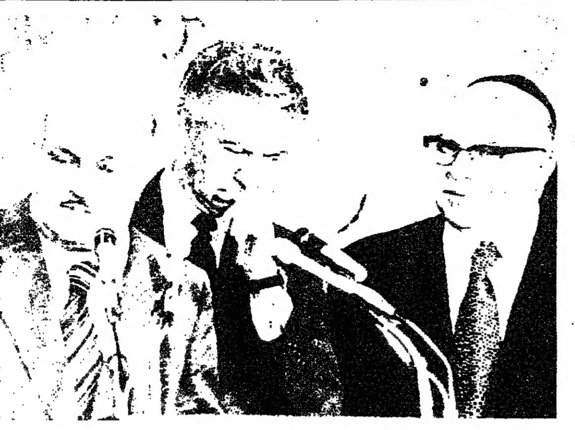
رؤساء الوفود الثلاثة خلال لقاءهم مع الصحفيين بعد الاتفاق على استئناف مفاوضات الحكم الذاتي.

صحيحة قطرية تنشر نص الميثاق المقترح لجامعة الدول العربية راسلنا للشؤون العربية - اوردت امس صحيفة البرية القطرية نص مشروع الميثاق الجديد المقترح لجامعة الدول العربية. ويدعو هذا المشروع الى تشكيل قوات عربية مسلحة تتدخل في النزاعات المسلحة بين الدول العربية بعد ان تكون كافة الوسائل الاخرى قد استنفدت. ويقتضي مشروع الميثاق الجديد ايضا باتمام لجنة عليا لجامعة تجمع دوريا وباشتراك وزراء الخارجية العرب، على ان توسع هذه اللجنة في المستقبل لضم وزراء الدفاع ايضا حيث ستعالج قضايا اجتماعها المواضيع الانية مثل الصناعات العسكرية المشتركة والتعاون بين الجيوش العربية.